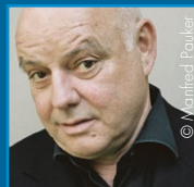
Wolfgang Böck Theaterintendant, Schauspieler